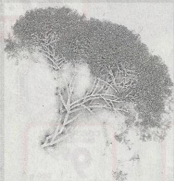
Stefanus Rademeyer se foto-kunstewerk Arborescent Geometry VI

pend. Daar is ongewone beeldhouwerk, klank- en mobiele installasies, afdrukke en foto's en skilderye. Selfs die buite-omgewing van die gebou, uit die laat-1930's, word ingespan.