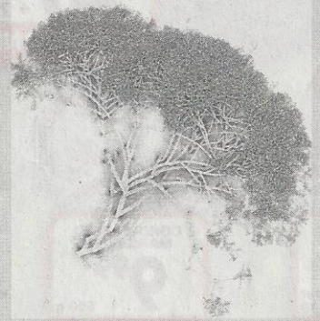
Stefanus Rademeyer se foto-kunstewerk Arborescent Geometry VI

pend. Daar is ongewone beeldhouwerk, klank- en mobiele installasies, afdrukke en foto's en skilderye. Selfs die buite-omgewing van die gebou, uit die laat-1930's, word ingespan.