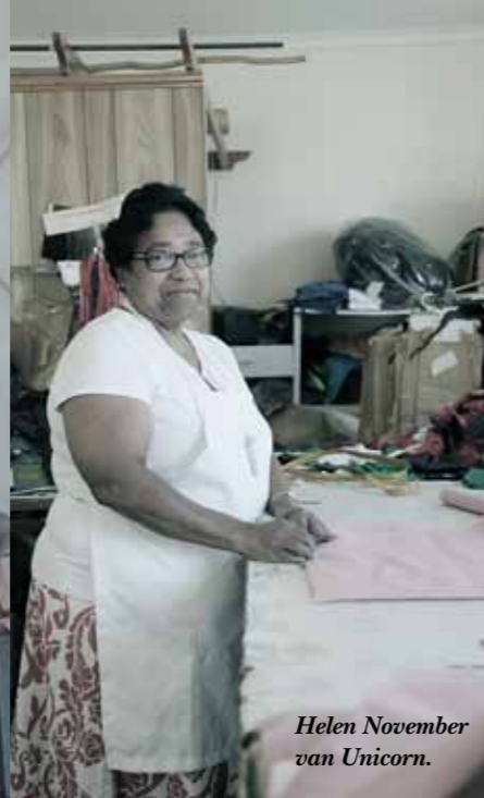
Helen November van Unicorn.