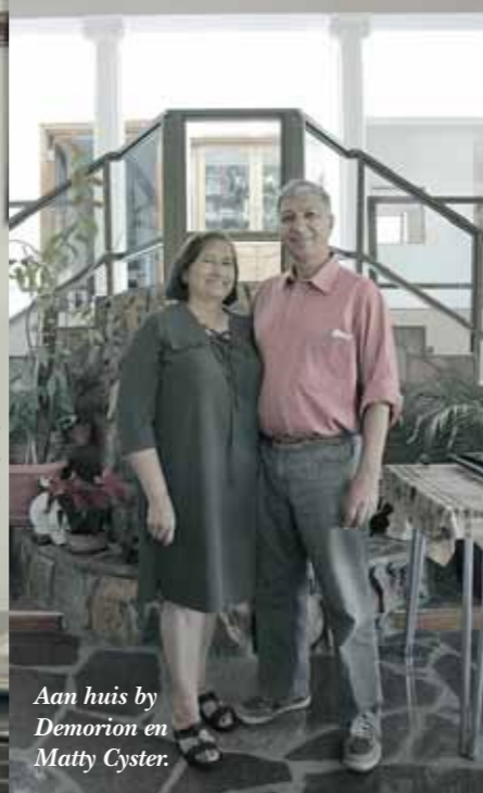
Aan huis by Demorion en Matty Cyster.